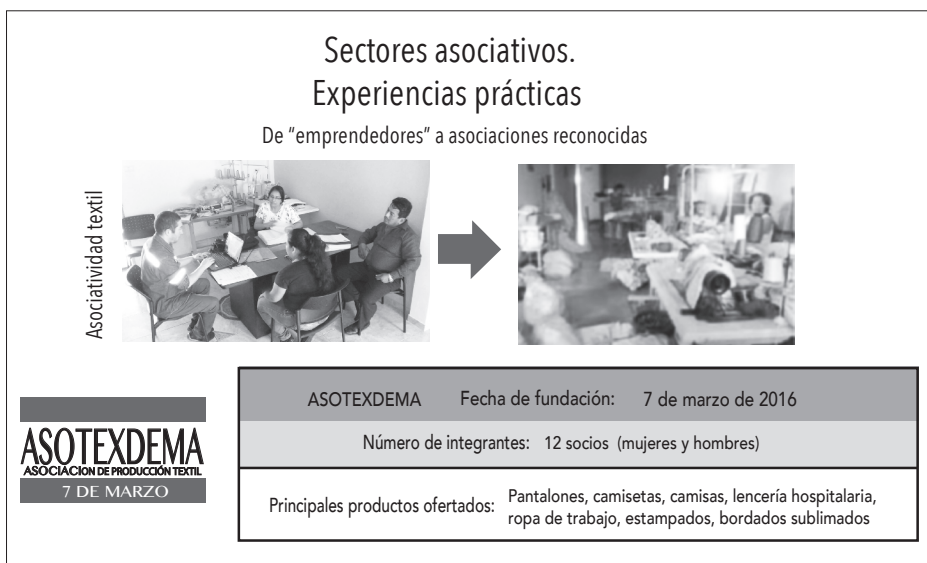
Figura 1. Información relevante sobre ASOTEXDEMA

Ambos espacios de trabajo facilitaron la interrelación con otras asociaciones en condiciones similares, tanto del sector textil como de otras ramas artesanales.